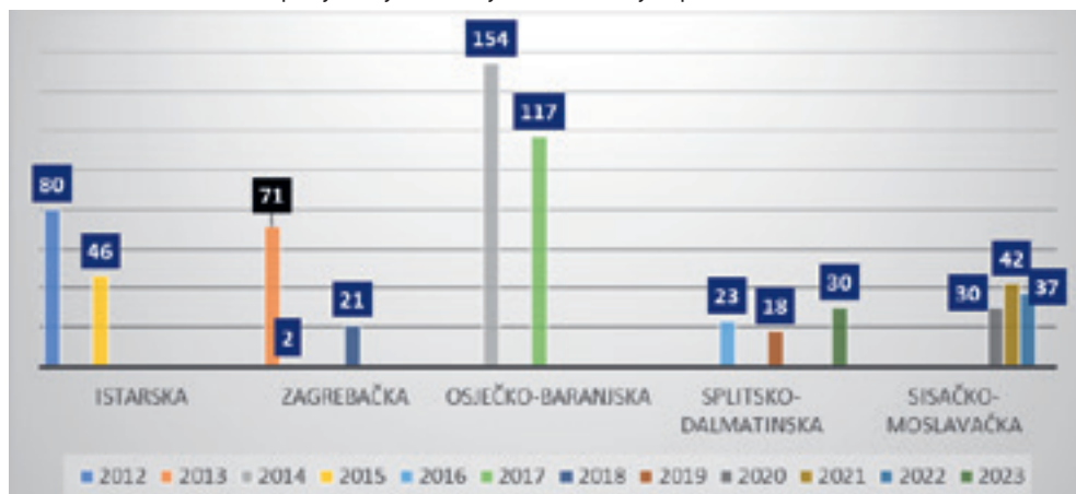
Grafikon 2. Županije s najvećim brojem kaznenih djela protiv okoliša u RH 2012-2023

Izrada: autori, prema MUP-a, RH-e, 2023.